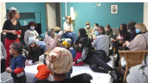
Accueillis au CADA

Le CADA comptait, au jour de la conférence, 30 enfants et jeunes âgés de 4 mois à 17 ans et pour la plupart scolarisés dans les écoles de la Ville de Lille. Les personnes accueillies ont des origines différentes. Elles proviennent majoritairement des pays d'Afrique subsaharienne : Guinée, Nigéria, République Démocratique du Congo, Bénin et des pays du Moyen-Orient : Irak, Palestine, Afghanistan, Iran.